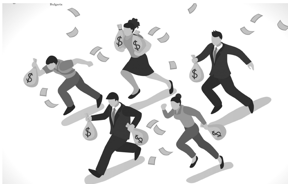
ФОКУС КЪМ ПРЕСЛЕДВАНЕ НА ПАРИ

Не трябва да забравяме, че оскъдните резултати на сегашната икономическа система и редките аномалии, в които се достига до по-голям прогрес, към настоящия момент са пряко отговорни за унищожението и деградацията на обществото, природата и въобще целия заобикалящ ни свят, без който човечеството няма шанс да просъществува. Наш дълг и отговорност пред бъдещите поколения е да се присъединяваме към хората, които на практика са доказали, че могат в дългосрочен план да постигат регулярни ежегодни резултати, които буквално умножават ефекта многократно вече повече от 15-20 години.