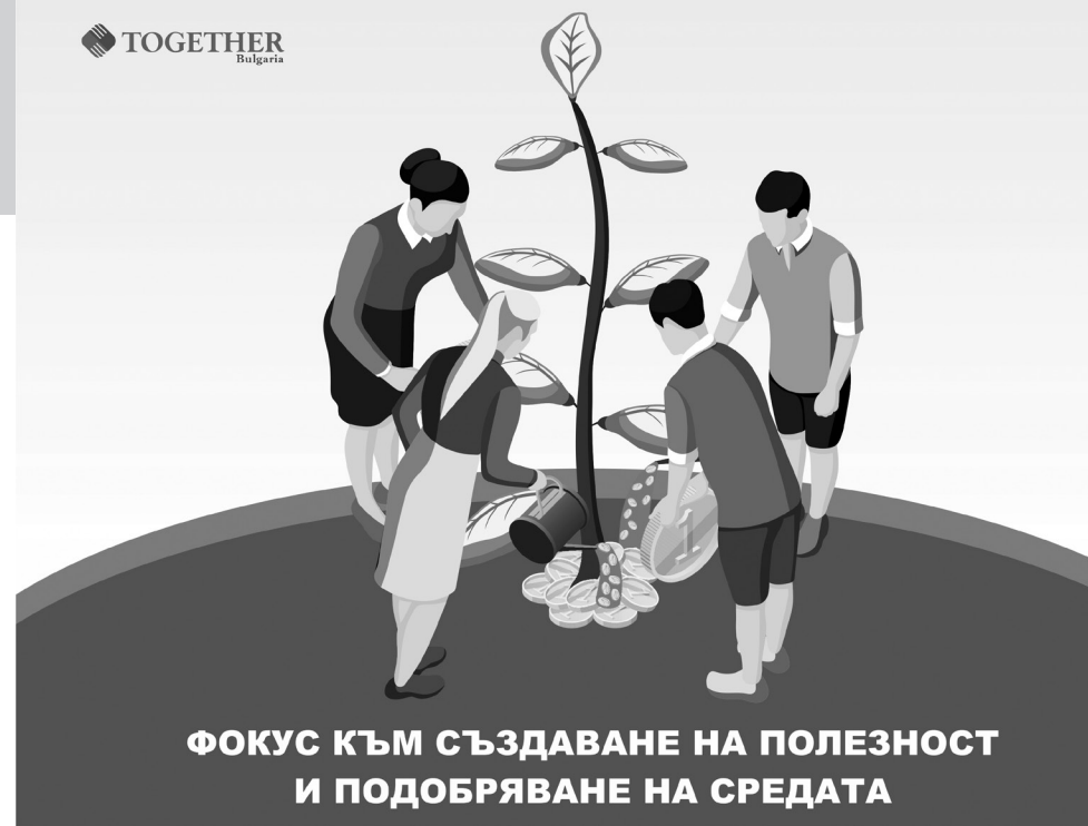
ФОКУС КЪМ СЪЗДАВАНЕ НА ПОЛЕЗНОСТ И ПОДОБРЯВАНЕ НА СРЕДАТА

самите ние част от нея. За да е сигурна невъзможността да се израства в тази система, големите корпорации създават частни армии, често в пряк контакт и в подкрепа на организираната престъпност, като в допълнение създават нужните лобистки политики и корупционни практики, чрез които да подсилят своето продължително съществуване и израстване.