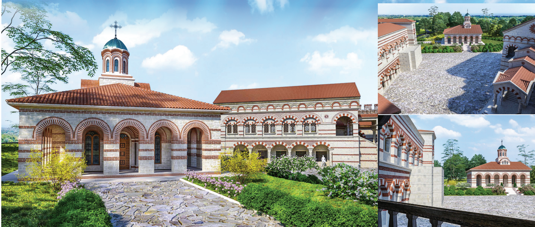
Църква „Св. Патриарх Евтимий“ - визуализация