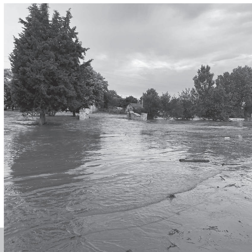
Снимки от наводнението през 2020 година.