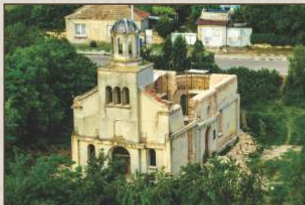
длежи на Средно село.

М алко хора си спомнят, че връзката ни с Бог е само и единствено наш ангажимент, а не на държавата. Научени да чакаме друг да ни оправи и с времето изгубихме вярата си, което се отрази на броя свещеници и състоянието на повечето църкви в люлката на Православието-България. Състоянието на църквите е отражение на вярата на хората в Бог. Загубата на вяра води и до безсмислие в живота. Няма пари, власт и известност, които да го запълнят. Време е да започнем да се грижим за нашите храмове и да учим себе си и децата на вяра в Бог.